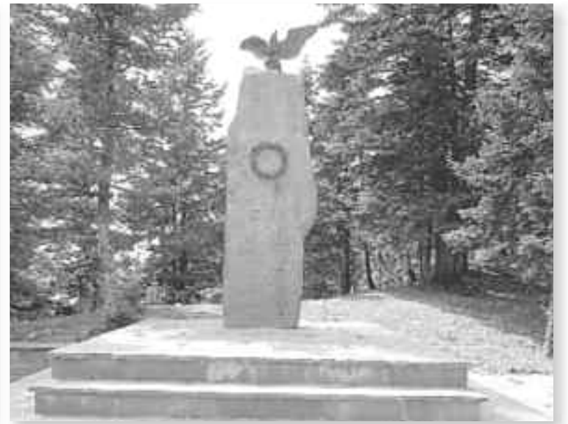
Το Ηρώο Πεσόντων στην Αγία Κυριακή της Ορεινής Ναυπακτίας.