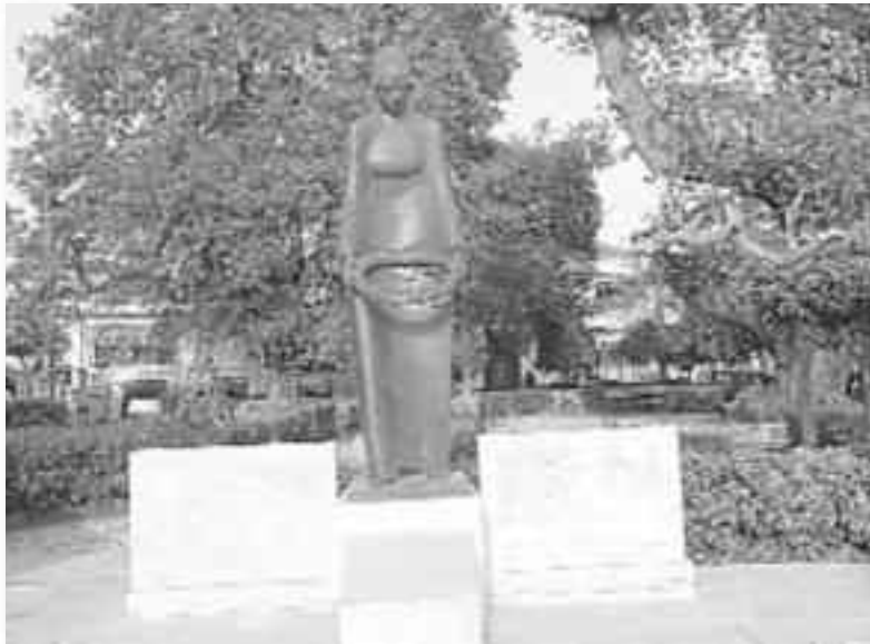
Στην Πλατεία Οξύλου δεσπόζει το Μνημείο Πεσόντων Αεροπόρων.

της (κοντεύουμε στο χωριό;) και μεγαλύτερο αδελφό της (εγώ θα το μουτζώσω!)).