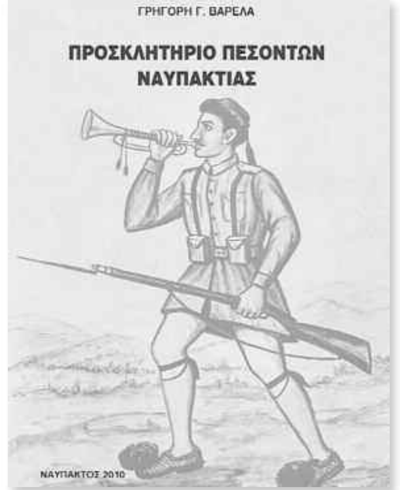
Το «Προσκλητήριο» ζητάει καταγραφή των Πεσόντων Ναυπακτίας.

Τέλος, έχει ληφθεί ομόφωνη απόφαση του Δημοτικού Συμβουλίου και εκκρεμεί η δημιουργία, στην